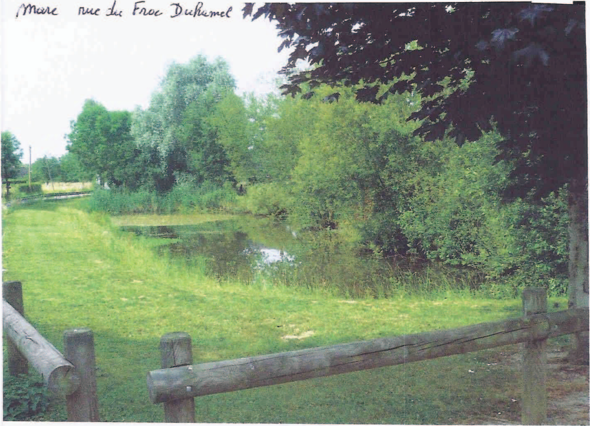
Mare rue de Froc Duhamel