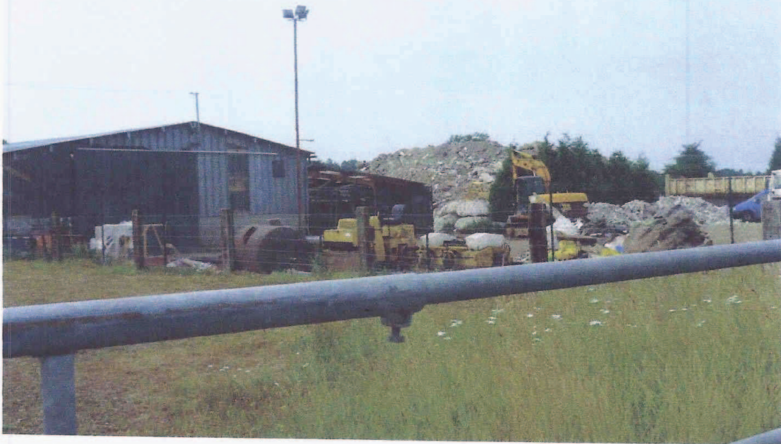
Vue de la parcelle ZH 97. en arrière parcelle ZH 96.